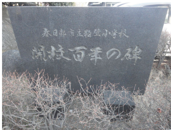
図8. 春日部市立粕壁小学校に建つ石碑

正門を入って左側に、碑銘「春日部市立粕壁小学校 開校百年の碑」の石碑が建てられている。その裏面に、沿革の概略が記されており、「大正十二年九月一日 関東大震災のため、本校舎が倒壊する。」と刻まれている。