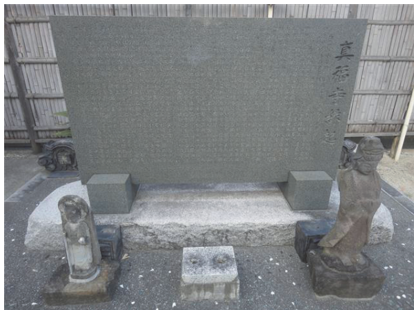
図 6. 真福寺に建つ石碑

取神社である。西川山の由来は、昔の利根川や古利根川の流路の名残として、この付近に西川とよばれる小川が流れており、関東地震の際に川跡が陥没したことを古老から聞かされていたためと推定されている。