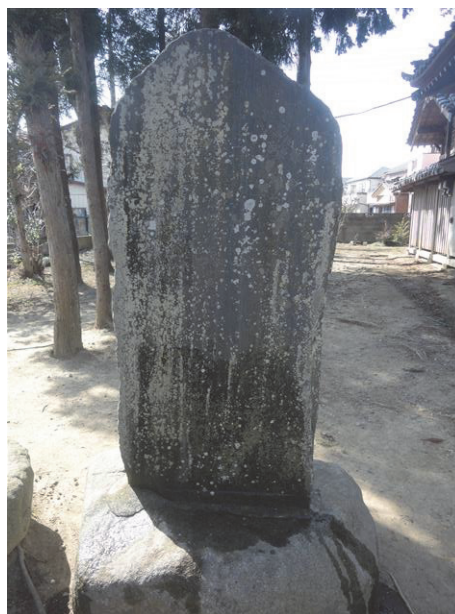
図 7. 元新宿八幡神社に建つ石碑

正面の下段には、「世話人」6人と「當番」4人、棟梁1人の氏名が記されている。さらにその下に、人名が複数(石碑の風化により、正確な人数の判別は不可能)、最後に「石工」1人が記されている。石碑の正面に記されている神社の造営に携わった(資金を投じた)方々の氏名であると考えられる。