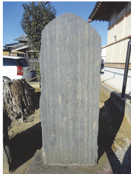
図10. 大沼香取神社に建つ石碑

石碑の裏面には、「浄法庵改築寄附芳名」として、2段にわたって寄付者30人の氏名と寄付金額（合計587円）が記されている。その下には、「世話人」6人の氏名が、石碑裏面の左端には「大正十五年十一月十五日」と記されている。