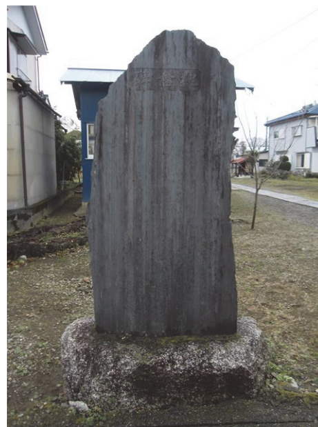
図 11. 増戸神明神社に建つ石碑

社張幕」の寄付者の氏名が町名と共に記され、続けて 22 名の氏名と寄付金額(合計 238 円)が地名と共に記され、3 段目の最後に「花崗石敷手間 岩槻町石工」1 名の氏名が記されている。その下には、当社委員が 7 名記されている。特志供資人名として記されている人名に付されている地名は、「東京神田東竜閑町」・「東京府下南千住町」・「東京深川西元町」(2 名)・「東京府下高田町水久保」・「新和村字尾ヶ崎」・「東京府下岩淵町字下村」・「東京府下池袋」・「武里村一ノ割」・「川通村字大口」・「内牧村字梅田」・「豊春村字花積」・「岩槻町字出口」・「河合村字平林寺」・「草加町長沼」・「河合村字馬込」・「川通村字新方須賀」・「新和村字末田」・「川通村字南平野」・「豊春村字新方袋」・「日勝村字太田新井」・「岩槻町」・「豊春村谷原新田」と、春日部市やさいたま市岩槻区および東京都内の広範囲から寄附が寄せられている。