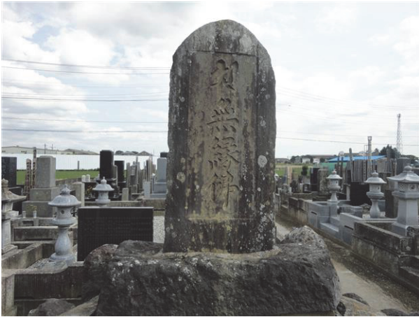
図 3. 大王寺別院（不動堂）に建つ石碑 Fig.3 The memorial stone built in the Fudou-dou of the Daiouji temple.

同じく住職の方に伺ったお話によると、当時の檀家で、その後に墓を引き継ぐ人が途絶えてしまった家の方々を集めたとのことである。同じ墓地内に、関東大震災によって亡くなられた旨が記述されている個人の墓も建っている。