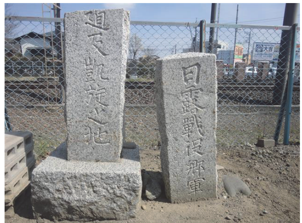
図 4. 大畑香取神社に建つ石碑 Fig.4 The memorial stone built in the Ohata Katori Jinjya shrine.

地震によって、旧武里村では160軒余りの住家が倒壊したことが記されている。これは、図1中に記述した諸井・武村(2002)による旧武里村の全潰数157とおよそ一致する。裏面のう上段に記されている年月より、この石碑は1923年関東地震が発生する前から建てられていたことが分かる。