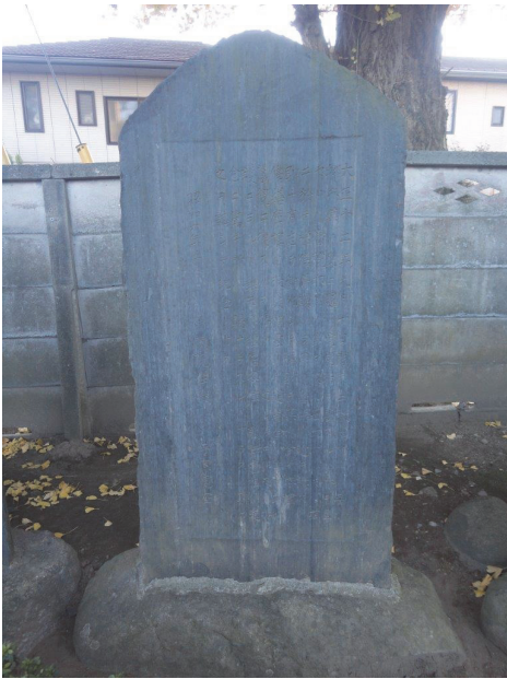
図9. 仲蔵院に建つ石碑

Fig.9 The memorial stone built in the Chuzouin temple.