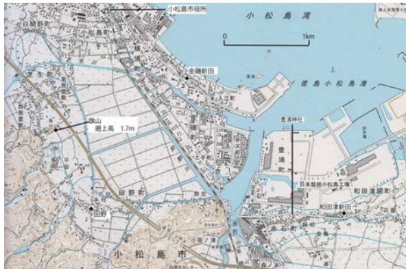
図3 小松島市田野の旗山、および和田津新田

田野旗山迄海嘯打懸也 と記されている。旗山の東端山裾の標高を測定して浸水高 1.7m を得た。和田津新田の豊浦神社の「ここに逃げかろうじて助かった」の伝承から 1.7m を得た。